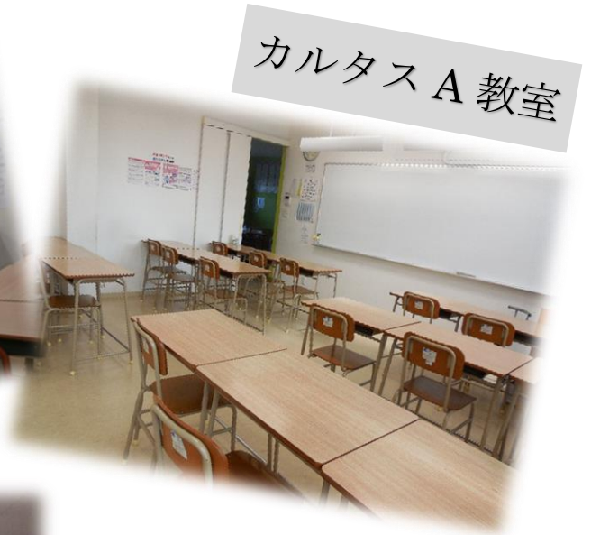
カルタス A 教室