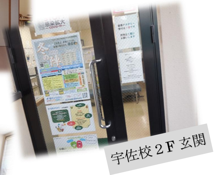
宇佐校 2 F 玄関