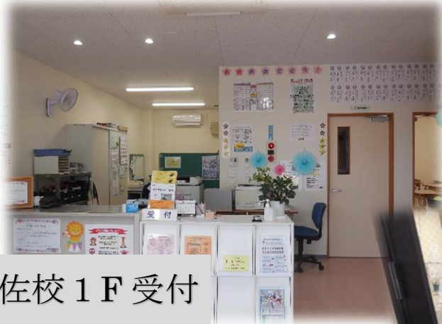
宇佐校 1 F 受付