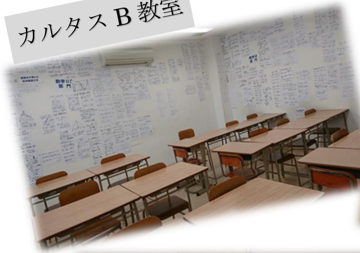
カルタス B 教室